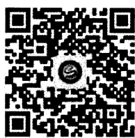
省农技协微信公众号