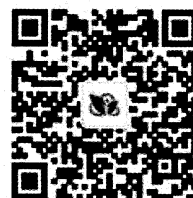
全国农业科教云平台 微信公众号