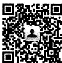
苏科惠微信公众号