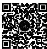
全国农民科学素质网络知识竞赛公众号